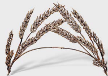
3 Ceres-Diadem 1. H. 19. Jh. Private Collection