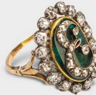
2 Diamantring von Eugène de Beauharnais Napoleonmuseum Thurgau, Schloss und Park Arenenberg

The jewellery of Napoleon's era was very different from that created before the French Revolution: it was more unobtrusive, but no less precious; rather, it was even more valuable. Its formal idiom was reminiscent of the Biedermeier style: delicate and, unlike the pompous Baroque jewellery, sleekly simple and finely crafted, gilded