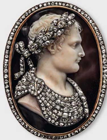
1 Brosche mit Porträt-Kamee Napoleons Nicola Morelli, frühes 19. Jh. Albion Art Collection