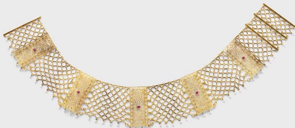
5 Halschmuck Vermutlich aus dem Besitz von Marie Louise, der zweiten Gemahlin Napoleons Deutsch (?), um 1820 Schmuckmuseum Pforzheim