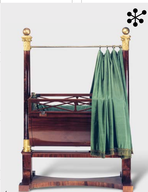
4 Wiege Vermutlich für eines der Kinder der Großherzogin Stephanie von Baden Karlsruhe, 1815-18 Badisches Landesmuseum Karlsruhe