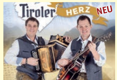
Tiroler HERZ NEU