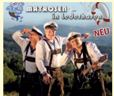
MÄHROSEN in Lederhosen NEU