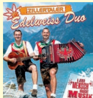
ZILLERTALER Edelweiss Duo A LICH MENSCH MUSIK