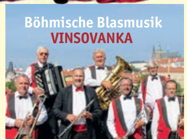
Böhmische Blasmusik VINSOVANKA