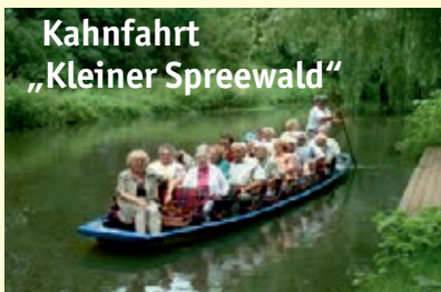
Kahnfahrt „Kleiner Spreewald“