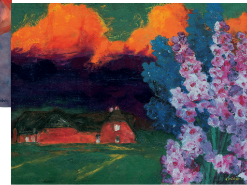
”Lun aften”, 1930, olie på krydsfiner