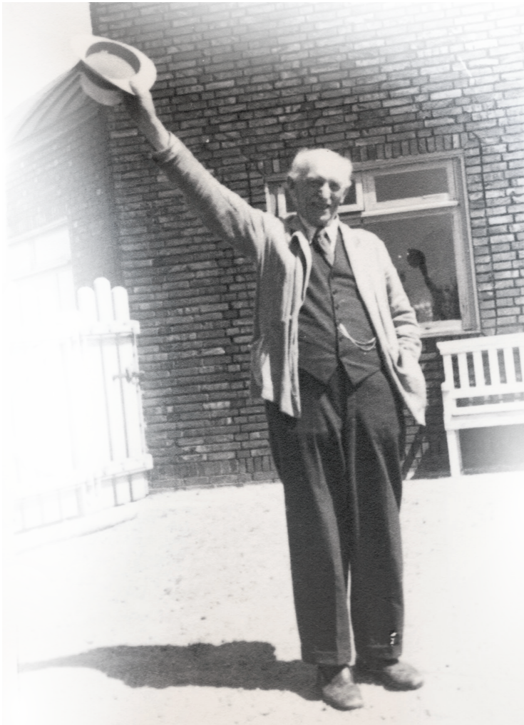
Emil Nolde, ca. 1940

OPLEV EMIL NOLDE I SEEBÜLL. HJEMME IGEN!