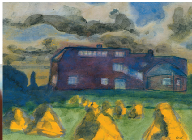
Huset Seebüll med høstakke, ca. 1940, akvarel

Ingen andre steder får man så omfattende et indblik i Emil Noldes værk. Her findes hans arv i form af verdens største Nolde-samling.