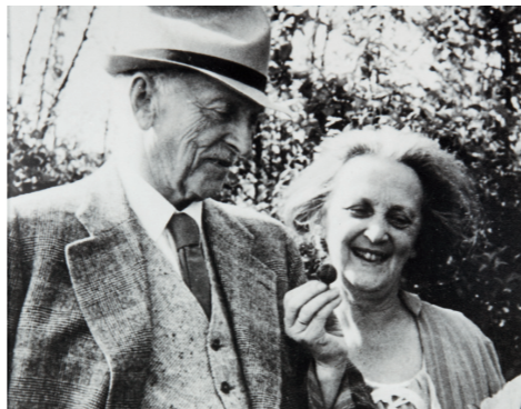
Emil og Ada Nolde i haven, 1941