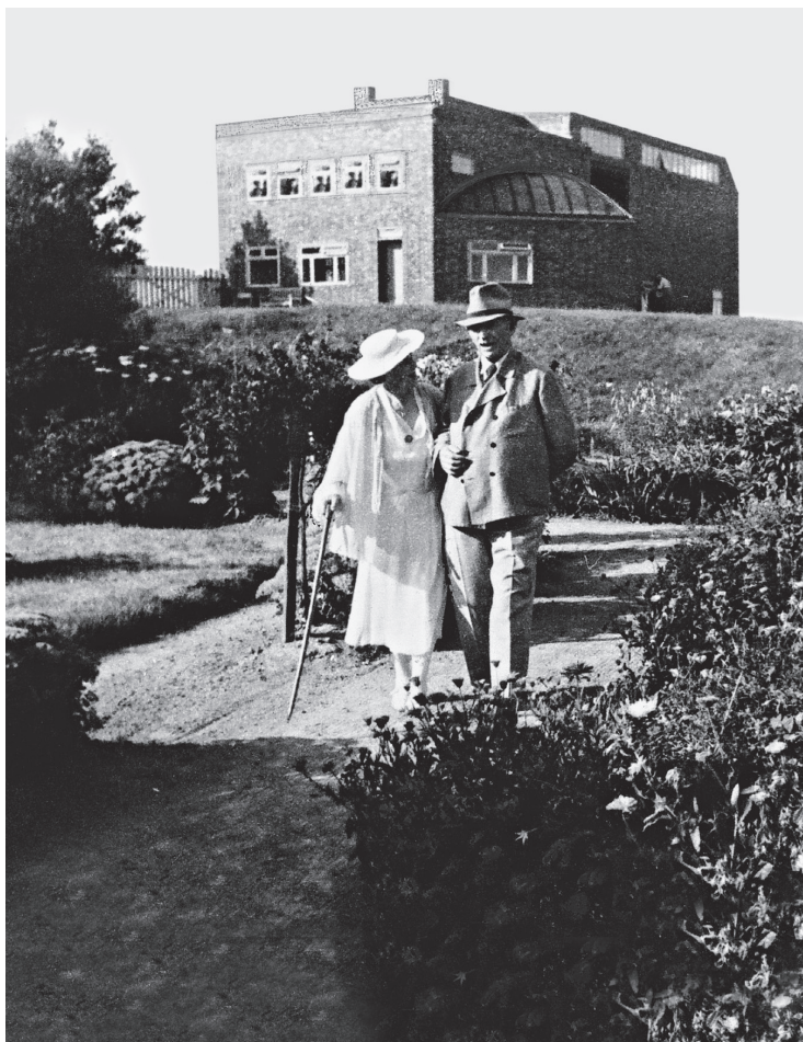
Ada og Emil Nolde i haven, 1941

OPLEV EMIL NOLDE I SEEBÜLL. HJEMME IGEN!