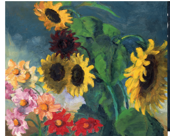
”Lyse georginer og solsikker”, 1943 Olie på lærred