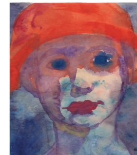
Pige med rød hat, akvarel

Den historiske Nolde-have og det nordfrislandske marskland gav kunstneren uendelig inspiration. ”Som et eventyr forekom hjemegnen og barndoms-hjemmet mig at være i det flade land, mit land”, skriver han bevæget, ”mit vidunderland fra hav til hav ...”